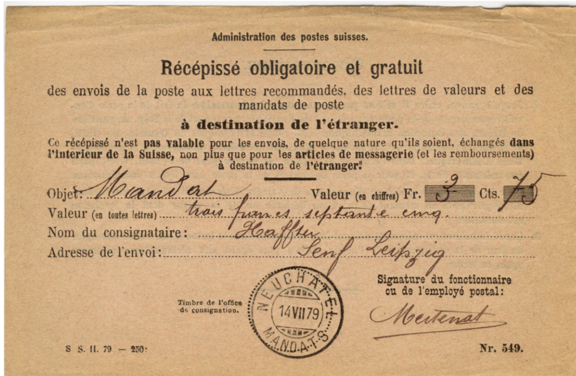
Abbildung : 549.F.1