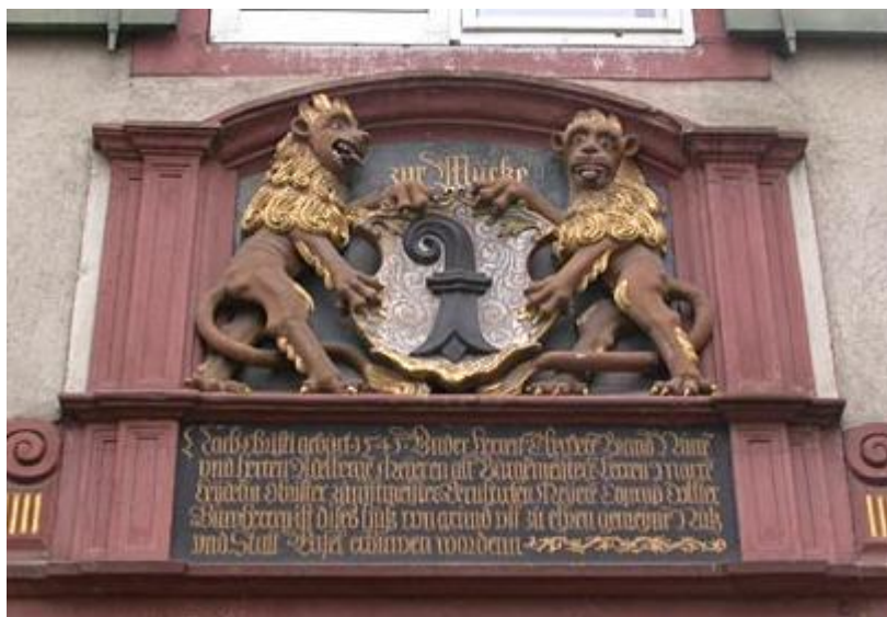
Teil 1 : Basel (ungeteilter Kanton bis 1833)

Gerechnet wurde in Basel meist mit dem Schweizer Franken; der Empfangsschein aus Liestal (siehe Abbildung BL.1) ist hingegen in Livres und Sols ausgestellt (1 Livre à 20 Sols, wobei 1 Livre etwa 1.10 Sfr wertete, 1 Sol demnach ungefähr 5,5 Rappen)